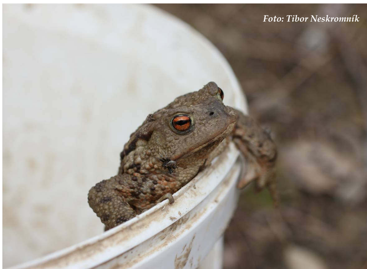
Foto 9: Ropucha obecná je hlavním přenášeným druhem u Svitáku (duben 2016)