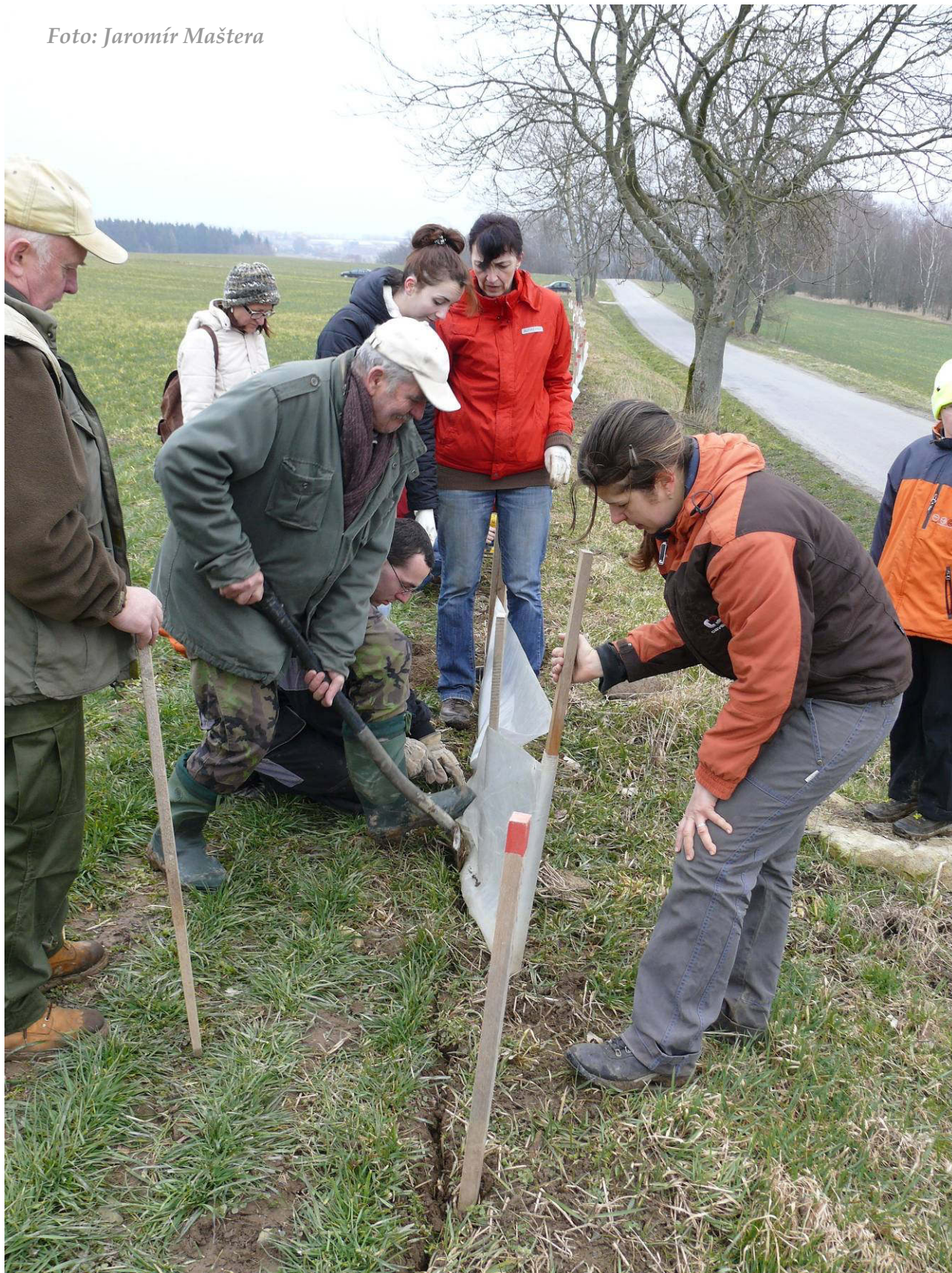
Foto 5: Zasouvání folie do drážky a kompletace zábran (březen 2016)