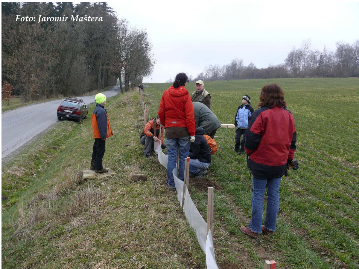
Foto 3: Instalace zábran u Svitáku – první tým v popředí, druhý v pozadí (březen 2016)