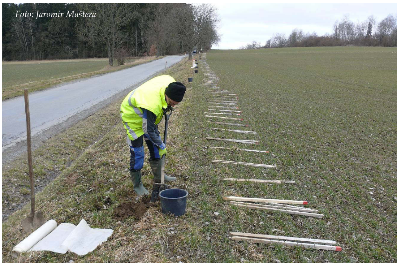
Foto 1: Budování zábran u Svitáku – usazování odchytných nádob (březen 2018)