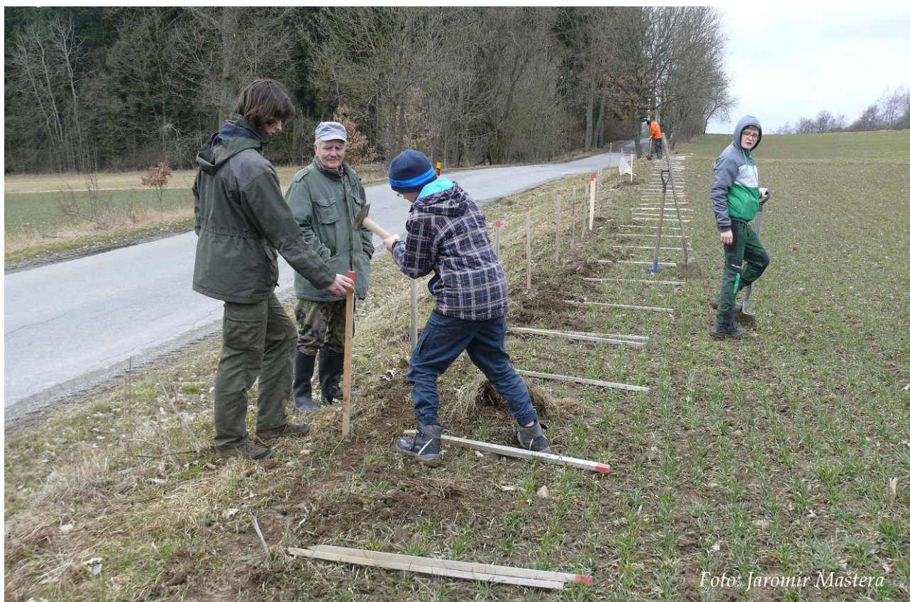
Foto 2: Budování zábran u Svitáku – zatloukání první řady kolíků (březen 2018)