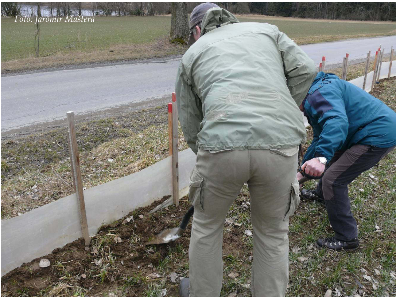
Foto 3: Instalace zábran u Svitáku – přihrnování natažené a uchycené folie (březen 2018)