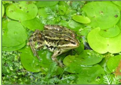
Pelophylax esculentus ( Rana esculenta ) skokan zelený