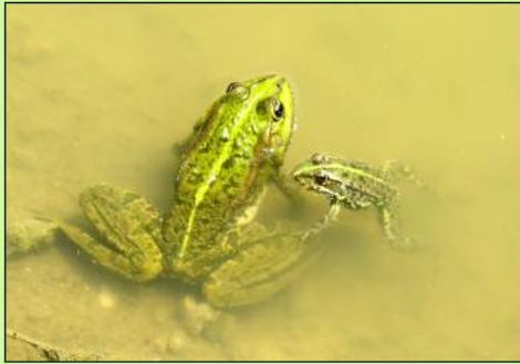
Pelophylax ridibundus ( Rana ridibunda ) skokan skřehotavý